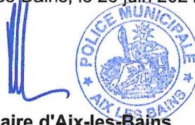
Le Maire d'Aix-les-Bains Renaud BERETTI